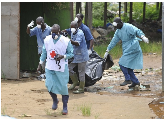
Octobre 2000 : des employés de la Croix-Rouge ramassent des dizaines de corps de victimes d'affrontements entre les partisans des trois principaux politiciens rivaux (Bédié Ouattara et Gbagbo).