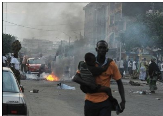
Le 3 décembre 2010 à Abidjan : affrontements sanglant entre partisans de Gbagbo et de Ouattara.

Seuls les travailleurs, c'est-à-dire ceux qui produisent les richesses et qui font fonctionner la société peuvent mettre fin à cette situation en s'organisant pour défendre leurs intérêts de classe exploitée. C'est un combat à mort qu'ils auront à mener pour se libérer de l'exploitation capitaliste mais aussi pour libérer la société toute entière de la domination de la classe parasitaire bourgeoise.