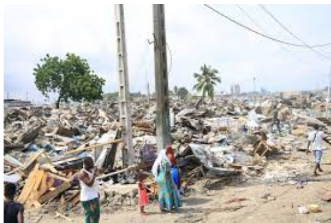
Le quartier de l'abattoir après le passage des bulldozers, le 1 er juin 2024.

Évidemment, la presse bourgeoise a titré : « zéro tolérance pour le vandalisme » ou encore « lutte contre le désordre urbain à Abidjan ». Mais pour les travailleurs et les pauvres, les vandales et les auteurs de désordre sont dans le camp des riches. Un peu partout à Abidjan l'État chasse les habitants des quartiers pauvres sous prétexte de la lutte contre l'insalubrité. En réalité, l'objectif de ces opérations révoltantes c'est de libérer les terrains occupés par les pauvres pour les céder aux riches qui veulent les transformer en espace commercial ou en lieu d'habitation destiné à une clientèle aisée.