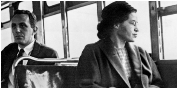
1 er décembre 1955 ; Assise dans un bus, Rosa Parks refusa de céder sa place à un Blanc

Le 1 er décembre 1955, à Montgomery en Alabama (Etats-Unis), Rosa Parks, une travailleuse noire (couturière) refusa dans un bus, de céder sa place à un passager blanc. Elle fut arrêtée pour « désordre public et violation des lois locales » et jetée en prison, avec une amende de 15 dollars.