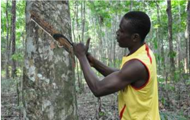
Préparation de la saignée de l'hévéa

Les travailleurs de la plantation d'Hévéa de Pakidié (dans la localité de Dabou) sont en lutte depuis plusieurs semaines pour exiger une augmentation des salaires, de meilleures conditions de travail ainsi que des logements décents. Jusqu'à présent, le patron refuse d'accéder à leurs revendications et emploie la force pour démoraliser les travailleurs, mais ceux-ci ne baissent pas les bras.