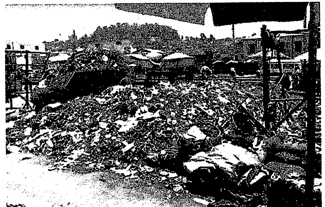
Une « montagne » d'ordures dans un quartier d'Antananarivo

Pour les habitants des quartiers pauvres et surpeuplés de la ville basse de cette capitale située à 1200 mètres d'altitude, pas beaucoup d'amélioration n'est en vue. Ils ont subi les inondations catastrophiques lors de la saison de pluies en décembre et janvier dernier et leurs