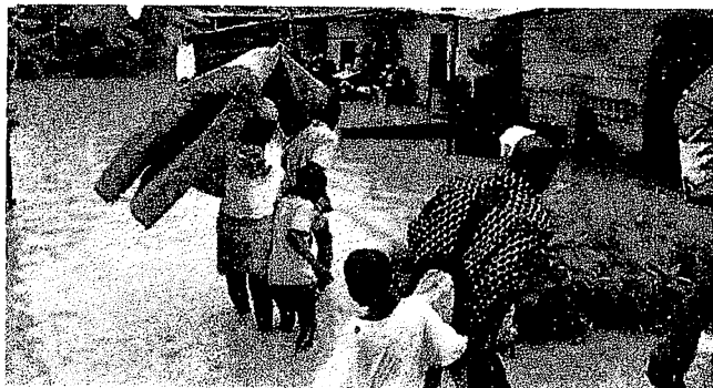
Un quartier d'Abidjan inondé

eaux de ruissellement et soulager ces populations. Mais il a refusé de prendre ses responsabilités. Il préfère mettre toute son énergie à « déguerpir » des pauvres gens et les mettre à la rue sans relogement, plutôt que de faire le travail qui lui incombe.