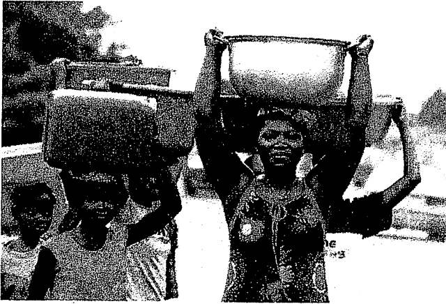
Abidjan : porteuses d'eau dans un quartier populaire

A Abobo, commune la plus peuplée d'Abidjan, il y a des quartiers où l'eau ne coule pas dans les robinets. Dans d'autres, l'eau n'arrive qu'à des heures tardives. Abobo Akeikoi, clouetcha, Dokui, Moronou, Biabou, sagbé, et bien d'autres encore sont concernés. La saison des pluies pour ces populations est donc une aubaine. Dès qu'il pleut, c'est souvent toute la famille qui s'y met pour recueillir l'eau qui coule des toitures ou des gouttières des bâtiments. C'est une occasion de remplir tous les récipients possibles pour faire des réserves en eau.