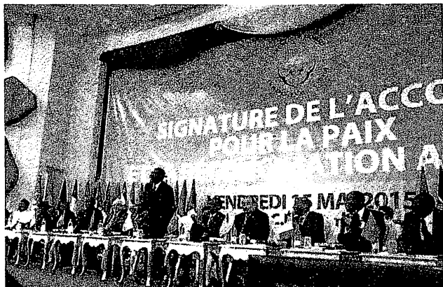
15 mai 2015 à Bamako : certains dirigeants touaregs ont refusé de signer

Le 20 juin, réunis à Bamako sous l'égide de l'Algérie, les principaux dirigeants de la rébellion touareg ont signé un « accord pour la paix et la réconciliation » avec l'Etat malien. Combien de temps durera cet accord ? Comment seront mis en œuvre sur le terrain les différents points de cet accord ? Personne ne peut le dire ; d'autant moins que ce n'est pas la première fois que les dirigeants de l'Etat malien et ceux de la rébellion au nord du pays signent ce genre de papier sans que cela aboutisse à quelque chose de vraiment concret et positif pour les populations.