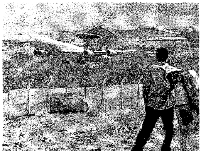
Un avion-radar Awacs décollant de la base militaire française de Dakar

La seule différence c'est que l'entité dans laquelle ils seront stationnés ne s'appellera plus « base militaire » mais « pôle de coopération militaire à vocation régionale ». Mais un caïman restera toujours un caïman même si on décide de l'appeler désormais « gros lézard »!