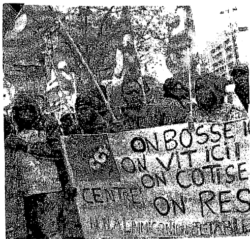
Le 13 février 2010, à Paris, des manifestants se dirigeant vers le siège du Medef

Le 13 février dernier une manifestation a rassemblé plus d'un millier de personnes pour réclamer la régularisation des sans-papiers. Cela a démarré à la gare Montparnasse pour se diriger vers le siège du Medef, syndicat patronal.