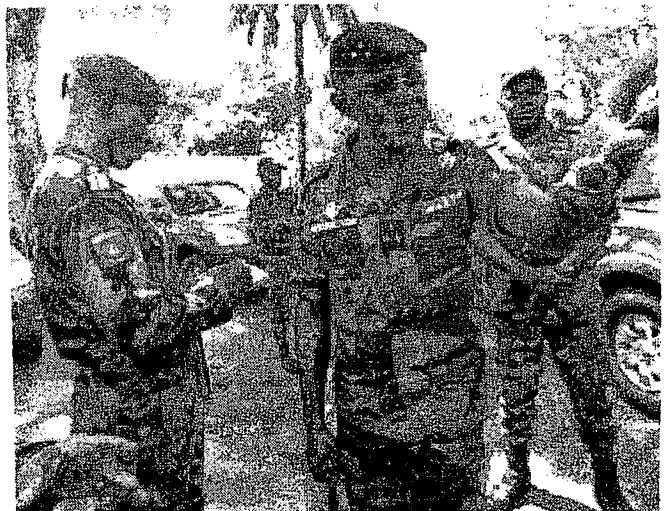
Le général Philippe Mangou à Yamoussoukro lors d'une manifestation le 17 février 2010

départ de Gbagbo et le rétablissement de la CEI.