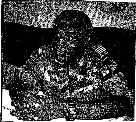
Le commandant Salou Djibo, devenu président du CSRD après le putsch du 18 février 2010

sont des événements plutôt bien ressentis par la population.