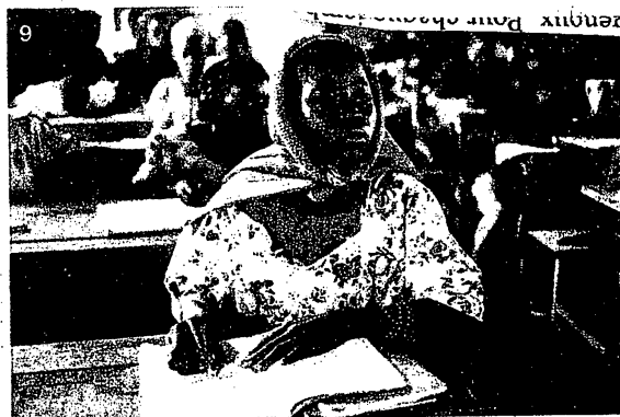
De nombreuses jeunes filles se suicident pour échapper au mariage forcé ou aux violences conjugales

Ce ne sont pas les petites gens qui s'adonnent à ces pratiques barbares mais des hauts dignitaires, des hommes d'affaires, des hommes politiques dont certains sont sortis des grandes écoles occidentales. Il est de notoriété publique que la plupart des chefs d'Etat africains ont leur marabout (ou leur sorcier) personnel. Ce qui, soit dit en passant, ne les empêche pas d'être parfois balayés par un coup d'Etat!