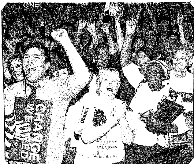
Las Vegas : la victoire de Barack Obama saluée dans la liesse par ses partisans

Barack Obama, un Noir américain est président des Etats-Unis depuis plusieurs semaines. Ce fut une grande manifestation de joie pour tous ceux qui ont voté pour lui, c'est-à-dire plus de 52% des électeurs. Bien sûr, plus particulièrement les Noirs américains et tous les antiracistes étaient les plus contents. Pour tout le monde, c'est un fait historique qu'un Noir non seulement se présente aux élections présidentielles mais en plus soit élu. C'était aussi une victoire pour ceux qui sont d'origine hispanique et indienne, et tous ceux qui sont d'origine africaine aux USA. Dans ce pays l'esclavage des Noirs n'a été aboli qu'en 1865, à la suite d'une guerre civile sanglante qui a opposé le nord et le sud du pays. Il y a une quarantaine d'années la ségrégation raciale a commencé à reculer à la suite de la lutte des Noirs pour les droits