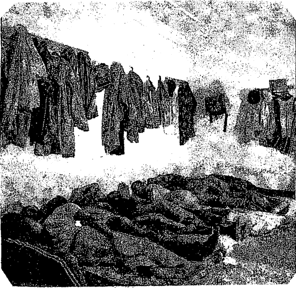
Des travailleurs africains en Libye dormant dans une pièce, à même le sol

Au début du mois de novembre les autorités libyennes ont procédé à des expulsions massives d'étrangers, notamment des immigrés venant de l'Afrique subsaharienne. Combien de personnes ont subi un tel sort ? Il est difficile de le savoir même de