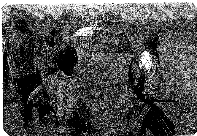
Des réfugiés en colère jettent des pierres sur des blindés onusiens de passage

Entre les accords de cessez-le-feu plus ou moins respectés ou même violés, les affrontements entre les rebelles dirigés par Laurent Nkunda et les armées loyalistes de Kabila fils continuent de faire rage. Des milliers de paysans habitant aux environs des zones de combats comme Goma, ou même pris en tenailles par les belligérants, fuient avec leurs maigres affaires.