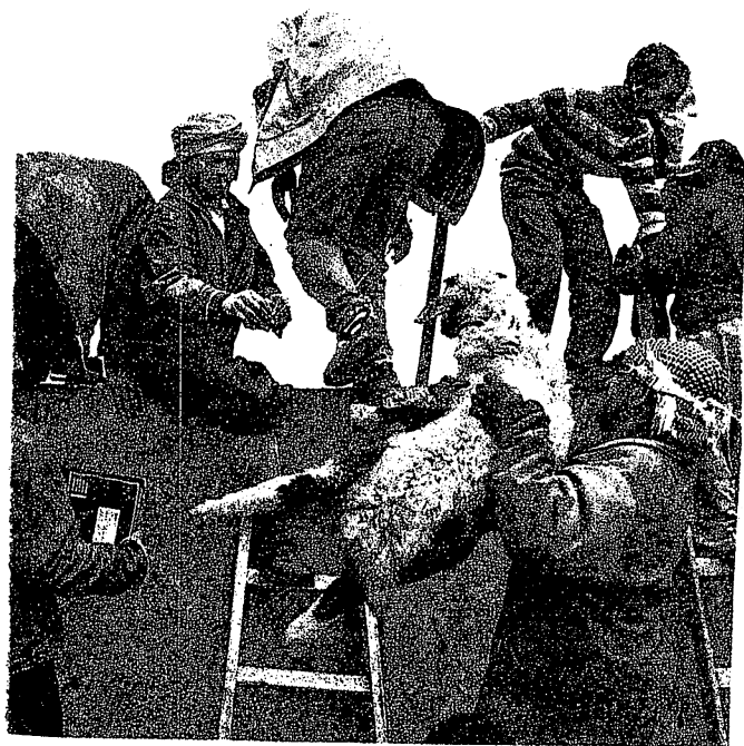
Rafah 26 janvier : des Palestiniens franchissant la frontière égyptienne

Dans la nuit du 23 janvier, les artificiers du Hamas ont fait sauter à plusieurs endroits le mur d'acier et de béton qui tient lieu de frontière entre la Bande de Gaza (territoire palestinien) et l'Égypte.