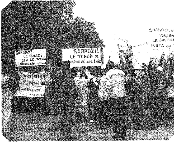
Manifestation anti-française les 8 et 9 novembre à N'djaména

locales, étaient fin prêts à montrer leur savoir-faire, et cela, sur la scène internationale. Sarkozy, maladresse ou pas, a jeté de l'huile sur le feu quand il a affirmé qu'il allait revenir au Tchad pour chercher le reste, c'est-à-dire qu'il allait ordonner à son sous-fifre Déby de libérer tous les membres de Zoé, quoi qu'ils aient fait.