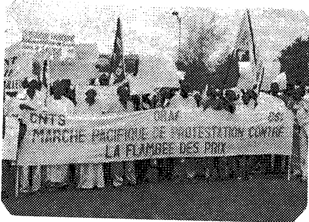
Dakar, juillet 2005 : marche protestation contre la flambée des prix

journee de «grève générale» avait été annoncée pour le 20 novembre.