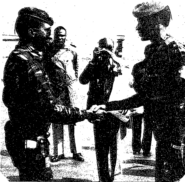
Aéroport de Ouaga, octobre 1984 Compaoré accueille Sankara de retour de Cuba

Le 15 octobre 1987, un groupe de militaires abattait à l'arme automatique le capitaine Thomas Sankara et ses proches conseillers. Quelques heures après la fusillade, un communiqué lu à la radio par un officier annonçait le nom de Blaise Compaoré comme nouveau dirigeant du pays.