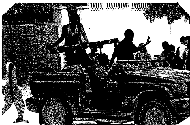
Mogadiscio 23 avril: hommes en armes des troupes islamistes

agissant de la sorte l'armée éthiopienne cherche à terroriser la population contre toute tentation de soutenir les insurgés. Cela a eu comme conséquence la fuite depuis la capitale de dizaines de milliers de personnes. C'est une situation révoltante. Cette offensive n'a pas pour autant empêché les insurgés de contrôler de vastes secteurs de la ville.