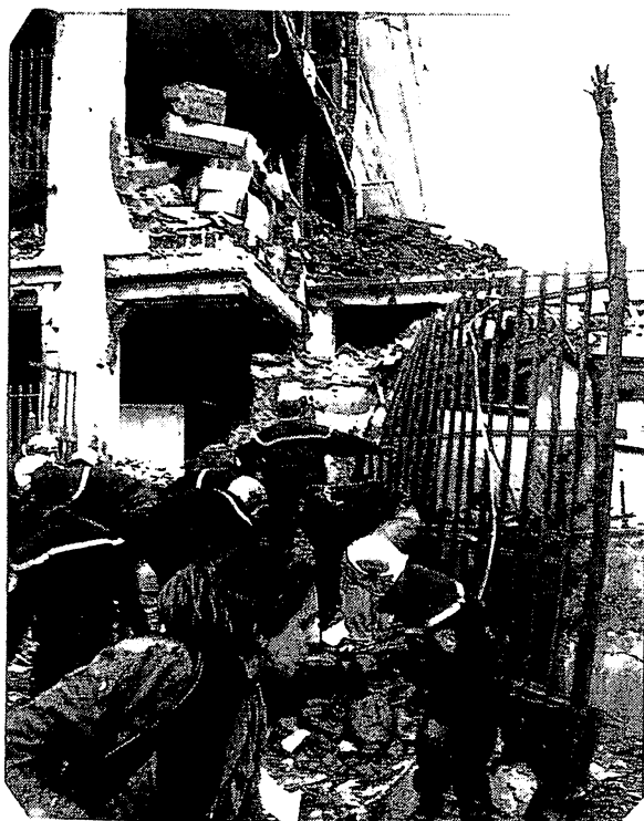
Alger: secours aux victimes du palais du gouvernement

blessés. L'un qui s'est produit à Alger a pris pour cible le palais du gouvernement, zone pourtant très surveillée, semble-t-il; l'autre a visé les bâtiments d'un commissariat à Bab-Ezouar dans la banlieue est d'Alger.