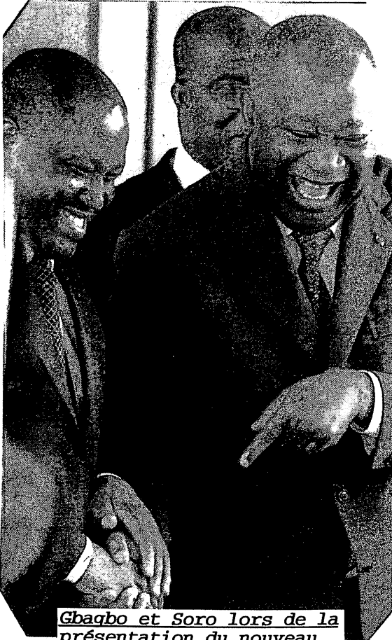
Gbagbo et Soro lors de la présentation du nouveau gouvernement à Abidjan

nouveauté, c'est qu'il y aura maintenant des «brigades mixtes» composées de soldats «loyalistes», de soldats «rebelles» auxquels