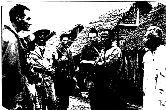
Rafle des suspects dans un village près de Tamatave

“rebelles”. Le corps expéditionnaire passa de 18 000 à 30 000 hommes et les moyens militaires