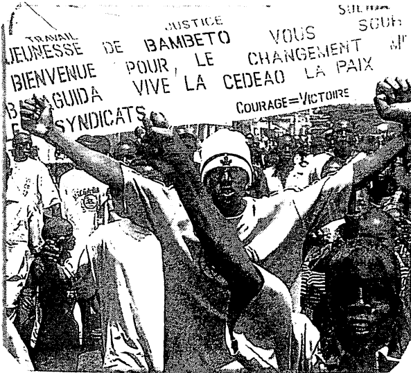
Manifestation de joie dans les rues après la décision de Conté de renvoyer son Premier ministre

Après avoir été reçu par Chirac et par Villepin, Lansana Kouyaté, le nouveau Premier minis-