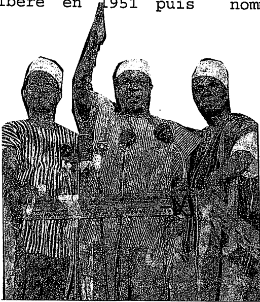
Kwame Nkrumah (au centre) lors de la proclamation de l'indépendance à Accra le 6 mars 1957

(22.780 voix sur 23.122 votants). Il est libéré en 1951 puis nommé