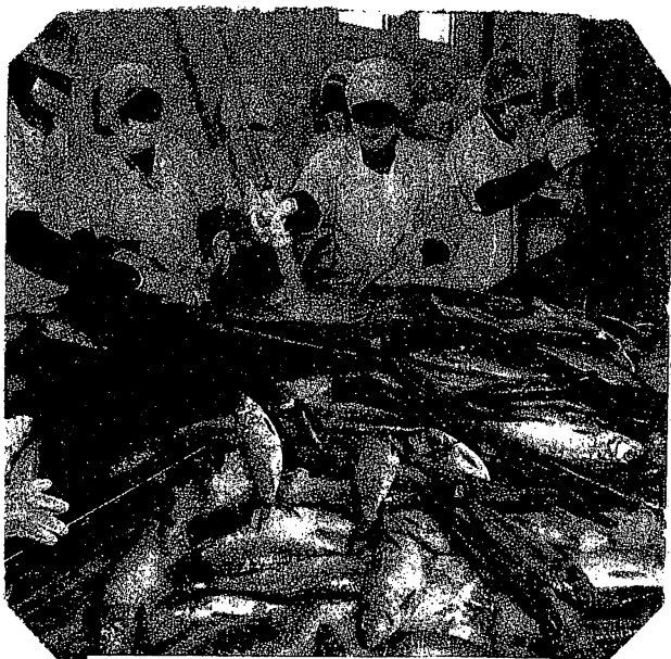
La pêche, une des activités principales du pays

prédécesseurs, il s'est engagé dans un processus baptisé « transition démocratique ». Cela s'est traduit par une certaine libéralisation du régime et l'organisation d'élections libres.