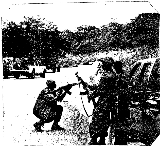
Octobre 2002: des rebelles contrôlant l'axe routier Bouaké-Yamoussoukro

les postes clés seraient aux mains du FPI et des Forces N o uvelles.