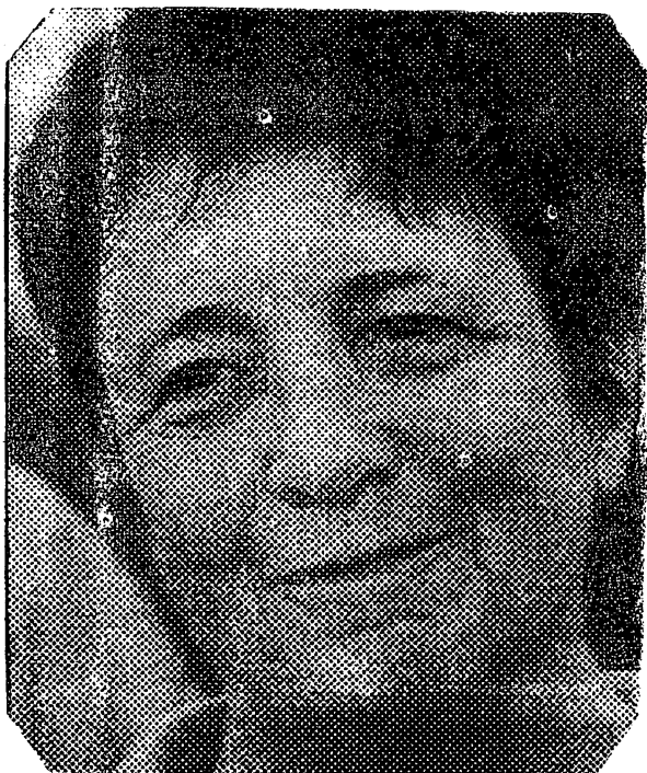
Arlette Laguiller, candidate de Lutte ouvrière (L.O.)

l'Etat français fait d'énormes cadeaux au patronat. En 2006 par