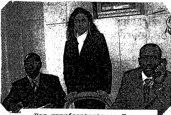
Des représentants en France du Front Uni pour le changement démocratique au Tchad (FUCD)