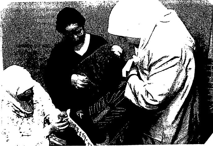
Femmes maghrébines portant le voile à domicile

Le port du voile à l'école par des filles mineures ne constitue pas une chose anodine. Certaines d'entre elles disent que c'est leur consentement. Mais même dans ce cas elles mettent des chaînes aux autres qui ne sont pas consentantes. Leur attitude pèse lourdement contre celles qui n'ont pas envie que les hommes (religieux ou traditionnels) leur imposent telle ou telle façon