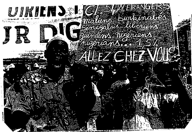
Manfestaion anti-étrangers à Abidjan en 2001

même région. Evidemment les deux communautés se suspectent, chacun accusant l'autre d'avoir commis des exactions sur les siens. En plus de ces meurtres, la communauté "autochtone" Guérés vient d'ajouter un autre point d'achoppement qui est le refus catégorique de voir le retour des Burkinabé dans leurs plantations. Il en est de même pour les "allogènes" Baoulés à qui il est interdit aussi le retour dans leurs plantations "avant la fin des conflits".