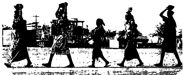
Des villageois dans un site pétrolier de Doba

comme gardiens ou surveillants, les compagnies pétrolières n'ont pas retenu grand monde. Découragés, certains ont dû rebrousser chemin,