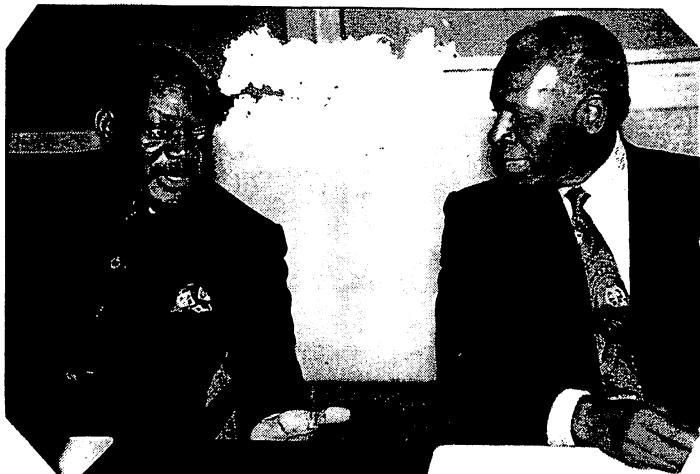
Savimbi (UNITA) et Dos Santos (président angolais)

La télévision a récemment montré plusieurs reportages effectués dans un centre médical de fortune mis en place par médecins-sans-frontières (MSF). Les images de gosses en bas âge, squelettiques et malades, abandonnés par leurs