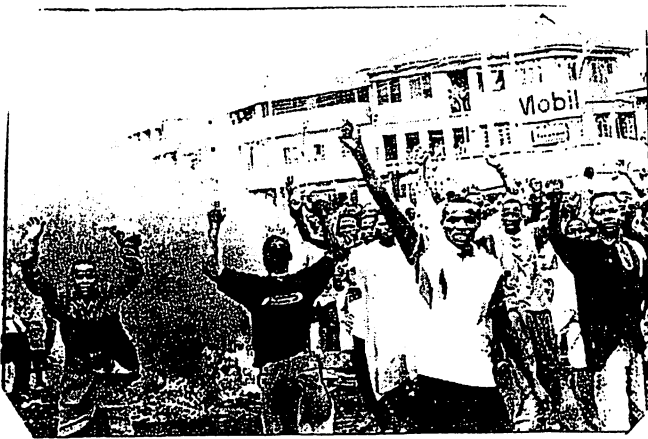
Emeutes après l'annonce de la mort d'Abiola

bénéficiant d'une certaine auréole auprès de l'opposition dont il a été le candidat à l'élection présidentielle de 1993, mais aussi auprès des grandes puissances qui n'ont rien à craindre d'un homme d'affaire milliardaire, a eu le mauvais goût de mourir prématurément à peine sorti de prison. Les grandes puissances comptaient sans doute sur son concours étant donné qu'il leur paraissait à même de jouer un certain rôle dans l'instauration d'un processus qu'elles baptiseraient de démocratique.