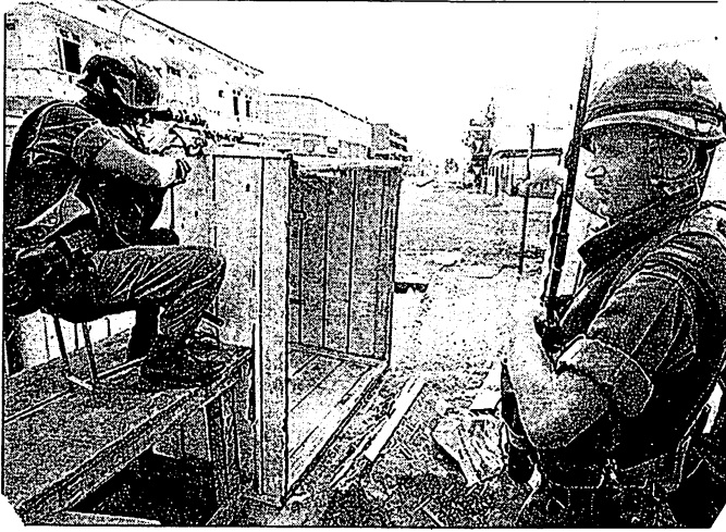
Paras français à Bangui en mai 1996

vers la voie des illusions électorales, plus dérisoires encore en Afrique que dans les pays impérialistes dits démocratiques.