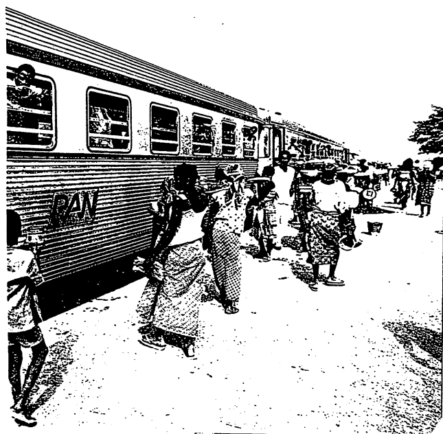
Sitarail (anciennement la RAN): Un train à quai

Les patrons profitent de l'occasion pour mettre à la porte les plus vaillants, les plus engagés dans la lutte, ainsi que tous ceux dont ils veulent se débarrasser. Au bout du compte, ceux des travailleurs épargnés par les