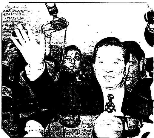
Président Lee Hoi-Chang, élu en pleine crise

Des officines religieuses de toutes sortes prennent le relais du gouvernement en faisant des piquets