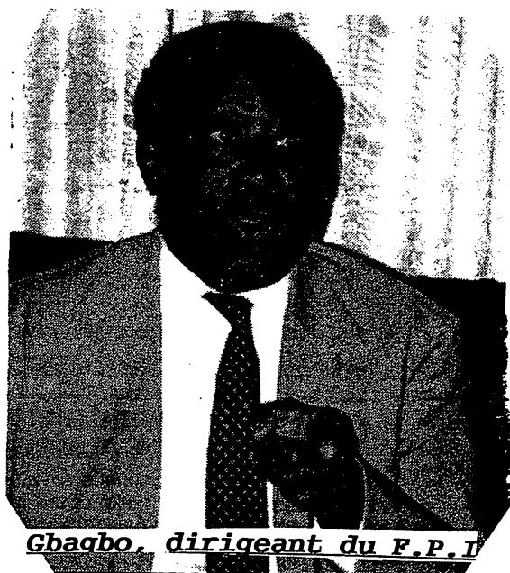
Gbagbo, dirigeant du F.P.I

Le 21 décembre dernier, lors d'un débat sur RFI au sujet de "la stratégie de conquête du pouvoir par les formations de l'opposition en Afrique", Laurent Gbagbo a affirmé que "les gouvernements d'ouverture, c'est la mort de la démocratie".