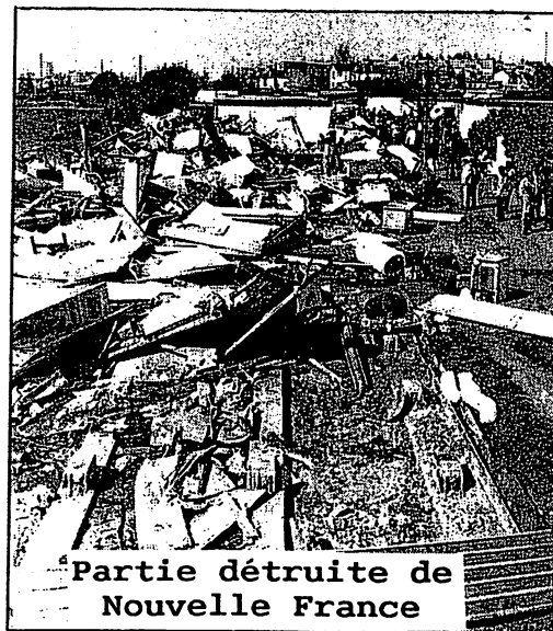
Partie détruite de Nouvelle France

Ce drame a déclenché une prise conscience et les premières révoltes des travailleurs africains résidant dans les foyers taudis contre les marchands de sommeil. Les grèves de loyers sont déclenchées presque spontanément: aux foyers rue Léon Gaumont à Montreuil, Riquet dans le 19ème arrondissement, rue Sedaine (11ème); les foyers Alsace Lorraine