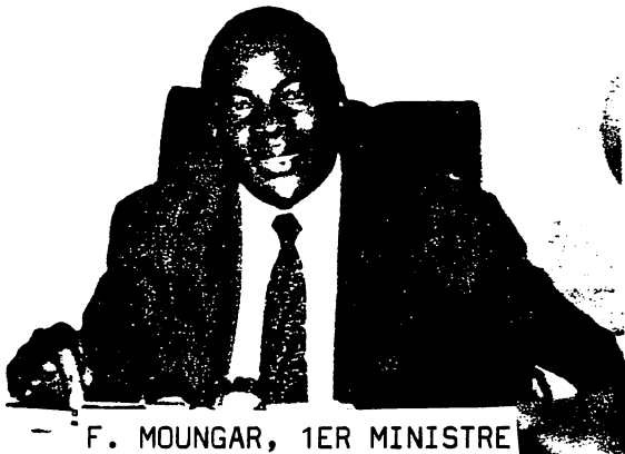
F. MOUNGAR, 1ER MINISTRE