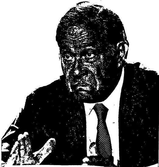
PASQUA MINISTRE DE L'INTERIEUR

militari 101 Maliens ? Alors pourquoi les policiers zélés se gêneraient-ils alors que l'exemple vient d'en haut ?