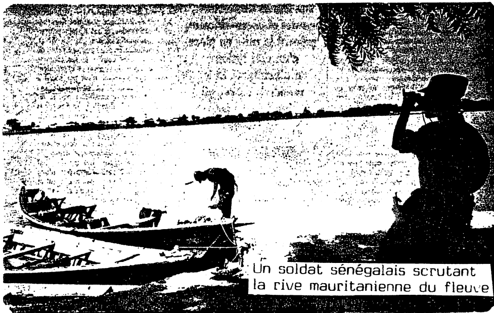
Un soldat sénégalais scrutant la rive mauritanienne du fleuve